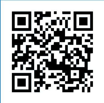
Nota, Gobierno Local