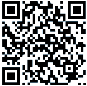
Video Taller: “La acción colectiva como Bien Común” (Abril 2019)