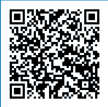
Post de la Municipalidad (Facebook)