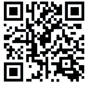
Presupuesto Participativo: San Ramón